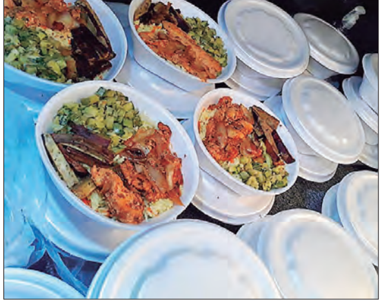
Produção de marmitex realizada no Buffet Villa Borghese