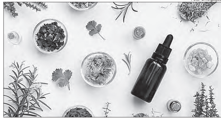
Florais, Aromaterapia e atividades ajudam a lidar com o isolamento e controlar as emoções

Combata o medo: Para os medos conhecidos como: de pegar o vírus, que pessoas próximas se contaminem, perder