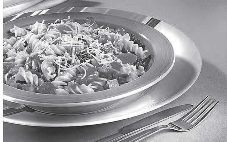
Parafuso Nutritivo com Frango e Legumes

Os gavetões da geladeira são os mais indicados para guardar vegetais. Isso porque estão mais