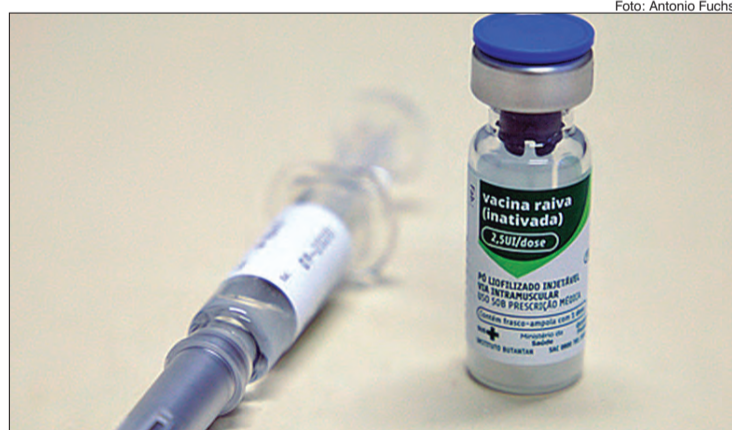
A imunização de rotina para cães e gatos será mantida

Na última quarta-feira (5), a Secretaria de Estado da Saúde informou que a Campanha de Vacinação contra a Raiva, foi adiada e que a medida foi adotada para evitar aglomerações durante a pandemia do novo coronavírus.