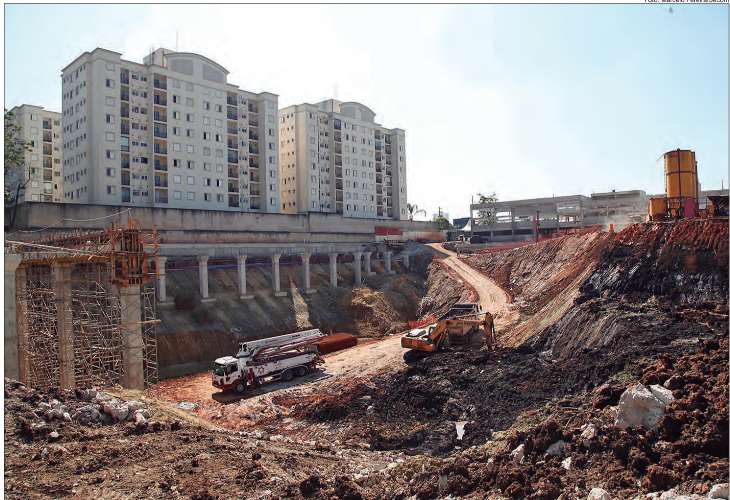
Obras de piscinão em andamento no Córrego Paciência