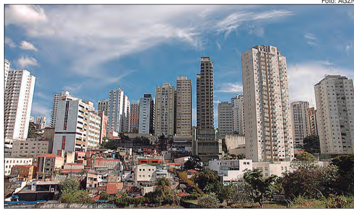
Na Capital, foram protocolados 1.290 processos, uma alta de 55,8% em comparação aos números de maio deste ano. No acumulado do semestre, houve queda de 22,3%

De acordo com levantamento feito pelo Secovi-SP (Sindicato da Habitação) no Tribunal de Justiça do Estado de São Paulo, em junho, foram protocoladas na cidade de São Paulo 1.290 ações locatícias, o que representa um aumento de 55,8% em comparação às 828 ações ajuizadas em maio deste ano. Considerando as 1.243 ações registradas em junho de 2019, a alta foi de 3,8%. Para ver o levantamento completo acesse: http://www.secovi.com.br/pesquisas-e-indices/analises/analise-locaticias?mc_cid=468bebed3f&mc_eid=e-b32b0a2b3