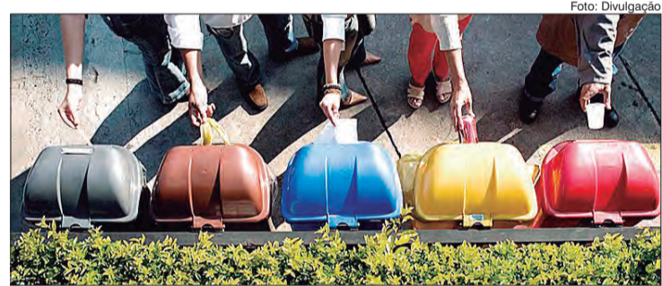
Crescimento da coleta seletiva em junho, converteu mais de 40 mil acessos ao site do Recicla Sampa

Desde que foi lançado, no ano passado, o Recicla teve mais de 265 mil acessos. Comparando janeiro a junho