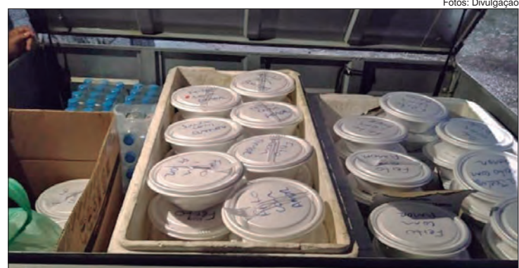
O projeto "Aquecendo com Amor" faz a distribuição de 160 marmittas todo domingo e segunda-feira