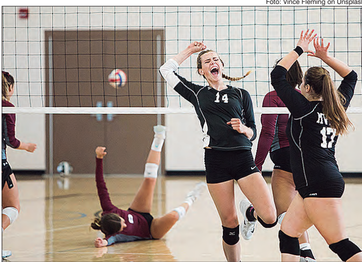
Modalidades como Futsal, Vôlei e Basquete estão autorizadas. A Liga Nacional de Futsal também teve seu protocolo autorizado