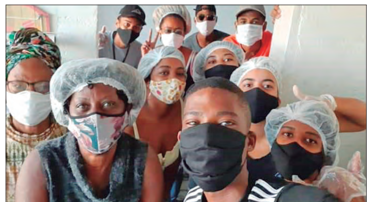
Integrantes do projeto "Aquecendo Vidas" e também do grupo de Samba "Samba Caçula" unidos para preparar as marmittas

A Paróquia Nossa Senhora da Piedade/Comunidade Santa Cruz está recebendo todo tipo de doação para ajudar os mais necessitados. A paróquia está distribuindo cestas básicas e também marmittas para mais de 100 famílias cadastradas, há quatro pontos de distribuição dessas marmittas, para saber os locais de distribuição das cestas básicas e das marmittas, entre em contato com o Padre Luís Isidoro. A comunidade está localizada na Avenida Cel. Sezefredo Fagundes, 6.500. Para mais informações: (66) 9 9680-2795 - Padre Luís Isidoro Molento.