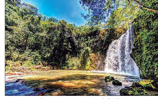
Belas cachoeiras, Jataí, Goiás

Para fechar o seu pacote, acesse: http://www.minds.travel.com.br