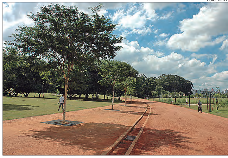
Parques estaduais voltam a funcionar no seu horário normal de segunda a sexta-feira

Do total de 12 cabines, duas ficarão no Horto Florestal; e três no Juventude. As instalações já foram iniciadas e serão concluídas até o fim desta semana.