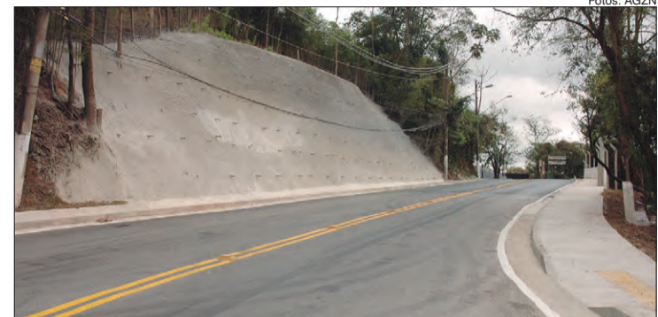
Muro de contenção na Avenida Cel. Sezefredo Fagundes