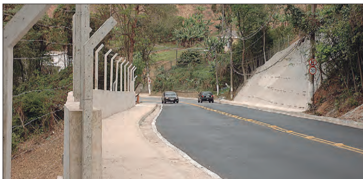
Após 180 dias as obras na Avenida Cel. Sezefredo Fagundes, enfim foram concluídas

E agora, enfim, a conclusão da obra na Avenida Cel. Sezefredo Fagundes, que liga São Paulo ao município de Mairiporã. Entramos em contato com a Prefeitura de São Paulo, por meio da Secretaria Municipal de Infraestrutura Urbana e Obras (SIURB), e foi informado que os trabalhos para a contenção do talude na Avenida Cel. Sezefredo Fagundes, na altura do número 5.590, foram concluídos na última segunda-feira (31/8).