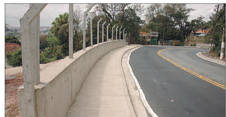
Depois de muitos transtornos para os moradores locais, as obras na Avenida Cel. Sezefredo Fagundes foram entregues