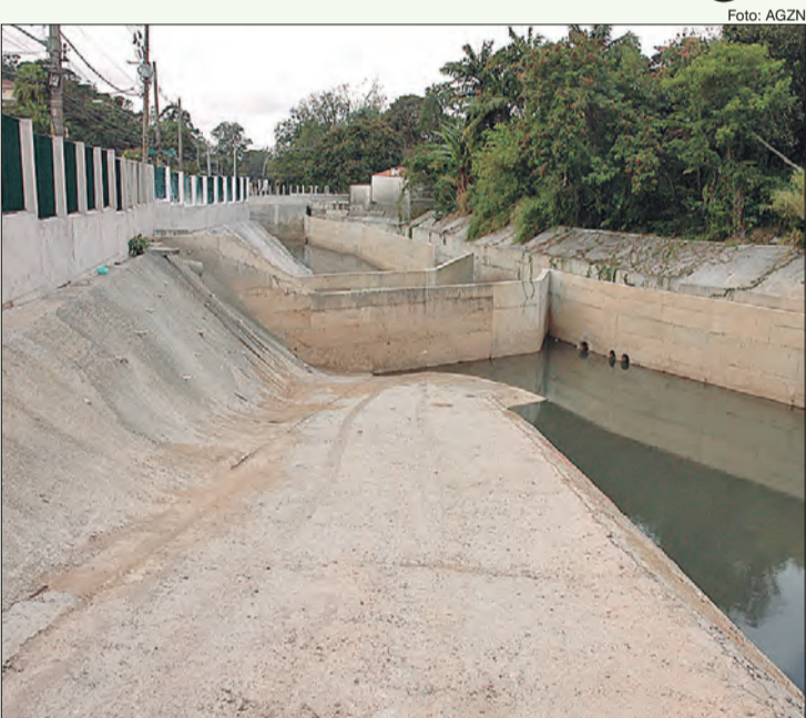
Obras de reservatório em fase de conclusão na Avenida Maria Amália Lopes de Azevedo

As obras de contenção das cheias ao longo do Córrego Tremembé, avançam com a conclusão do piscinão R3, localizado na Avenida Maria Amália Lopes de Azevedo. Com capacidade para armazenar 17 mil m 3 , o reservatório está em obras desde 2018. Porém, a Prefeitura informou que, desde o ano passado já opera,