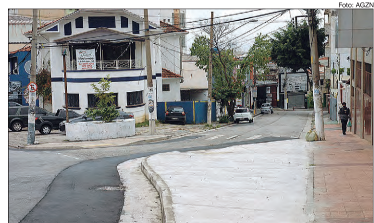
Avanço da calçada na Rua Amaral Gama, próximo ao número 185

tada pela CET visa a reduzir a exposição dos pedestres na pista veicular e diminuir o risco de atropelamentos. Os veículos que chegam neste cruzamento, devem estar a 30 km/h, velocidade atualmente regulamentada na Rua Amaral Gama e mais apropriada para o local.