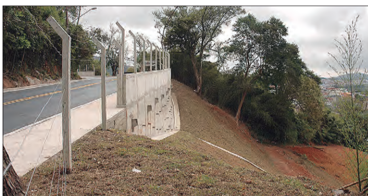
Segundo muro de contenção na Avenida Cel. Sezefredo Fagundes para evitar deslizamentos