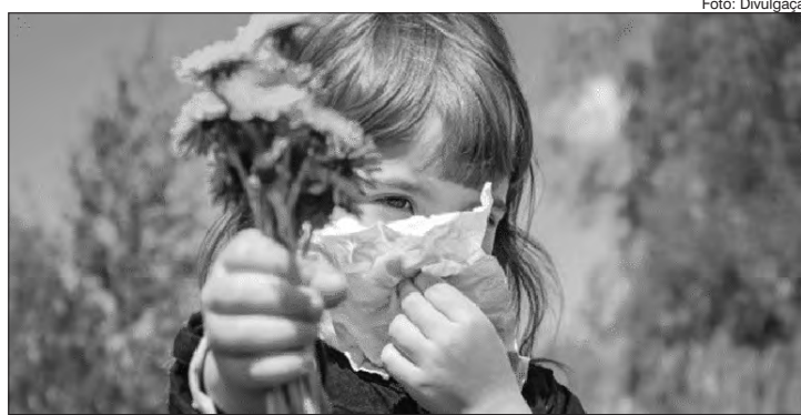
As crises alérgicas de pele e respiratórias continuam recorrentes, o mais correto é procurar um médico alergista, que poderá ajudar a tratar e melhorar a qualidade de vida do paciente, que fica extremamente comprometida com as coceiras

Mas e essas coceiras não relacionadas a nenhum produto? Essas, normalmente estão relacionadas às mudanças de estação. Pele ressecada e banho