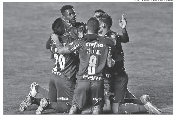
Após o gol, os jogadores do Palmeiras se juntam e comemoram