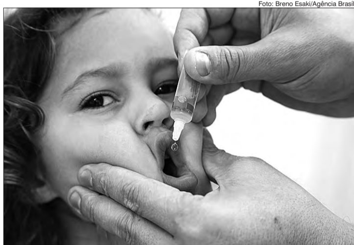
A meta da campanha é vacinar mais de 90% das crianças entre um e cinco anos de idade

Durante o mês de outubro, ainda acontece o Dia "D" de Divulgação e Mobilização Nacional, dia 17. Nessa data, todas as Unidades Básicas de Saúde