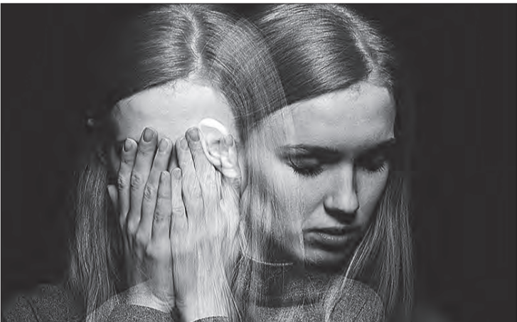
Tristeza profunda e contínua, apatia, desânimo, perda do interesse pelas atividades que gostava de fazer, pensamento negativo (ideias de fracasso, incapacidade, culpa, pensamentos de morte), alterações do sono e do apetite; são sinais de alerta

O tratamento do TCA se faz com medicamentos, prescritos por um psiquiatra, que controlam a compulsão, associados à terapia comportamental ou psicodinâmica. O acompanhamento de um profissional de Nutrição também é importante para a mudança dos hábitos alimentares.