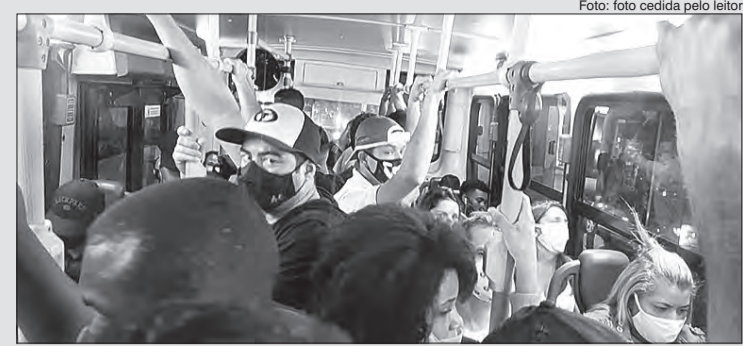
Ônibus lotado em um dos horários de pico

A linha 1783/10 Metrô Santana/Cachoeira teve ajustes ao longo da pandemia e, atualmente a