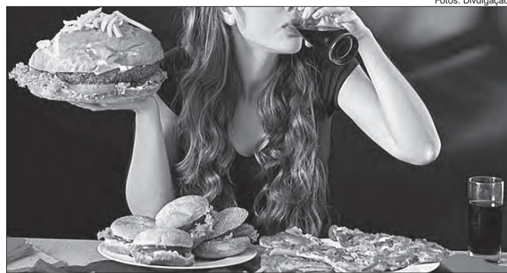
A compulsão alimentar pode levar a doenças como: Obesidade e Diabetes tipo 2