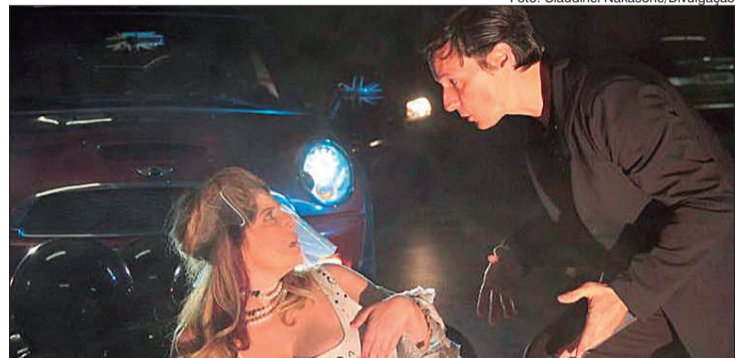
Cena de Amor no Drive-In

É UM HAPPENING de 37 minutos, onde a participação do público é realmente efetiva, com faróis, buzinas, para-brisas, pisca alerta e até a lanterna de celular. “O happening é assim, tudo pode e tudo muda de um dia para o outro, de minuto a minuto, dependendo do espectador e dos acontecimentos do dia”, explica o diretor.