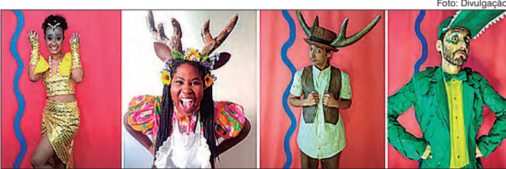
Espectáculo “A Menina Que Veio do Rio”