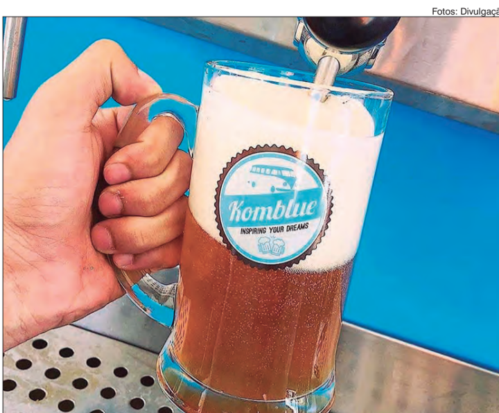
Choppes artesanais são ótimas opções para acompanhar as variedades dos pratos

Além dos 30 food trucks variados, o Chef Adan Garcia participará do festival e com o que há de melhor e mais inusitado quando falamos de carne suína, entre eles: o torresmo mineiro, torresmo de rolo, torresmos recheado, entre outros delícias.