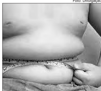
O mal afeta milhares de crianças e adolescentes e ganhou mais visibilidade com a mudança de rotina

Dormir bem e a volta ao ambiente escolar podem ser aliados nesta etapa de recuperação do peso anterior à pandemia,