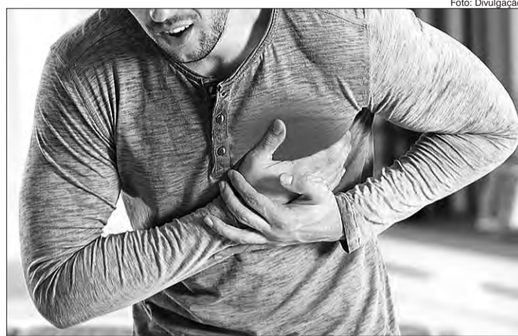
Cardiopatas, hipertensos e idosos devem ter atenção redobrada com nível de hidratação e uso de medicamentos

Outro quadro que merece atenção é o de desidratação. Em