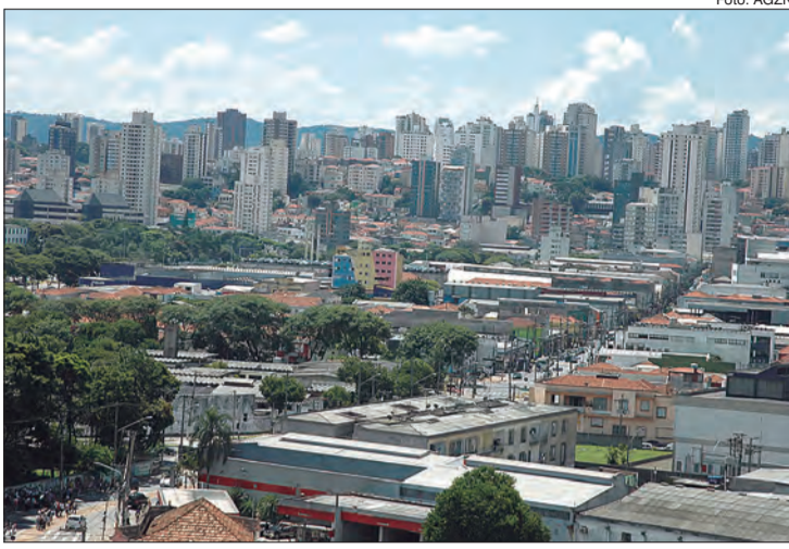
Santana, Mooca, Lapa, Liberdade e Pompéia

Liberdade - conhecido por concentrar imigrantes, especialmente japoneses, tornou-se um importante ponto turístico para quem busca conhecer a cultura, culinária e arte enraizadas