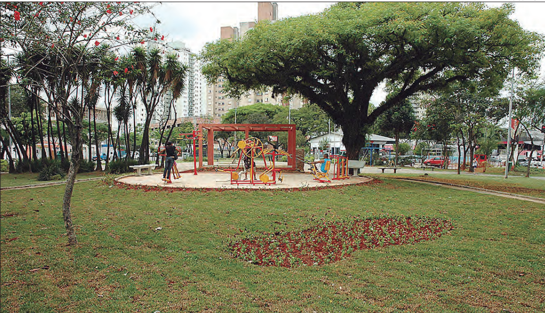
Parque Novo Mundo está entre os bairros que mais cresceram na Zona Norte

O Parque Novo Mundo comemora neste sábado (31), 82 anos de fundação. Sua formação se deu a partir do crescimento dos bairros vizinhos, Vila Maria e Vila Guilherme, impulsionando a procura por novos loteamentos nas proximidades, dando origem ao Parque Novo Mundo. Sua denominação foi inspirada na primeira instituição financeira a funcionar no local, o Banco Novo Mundo.