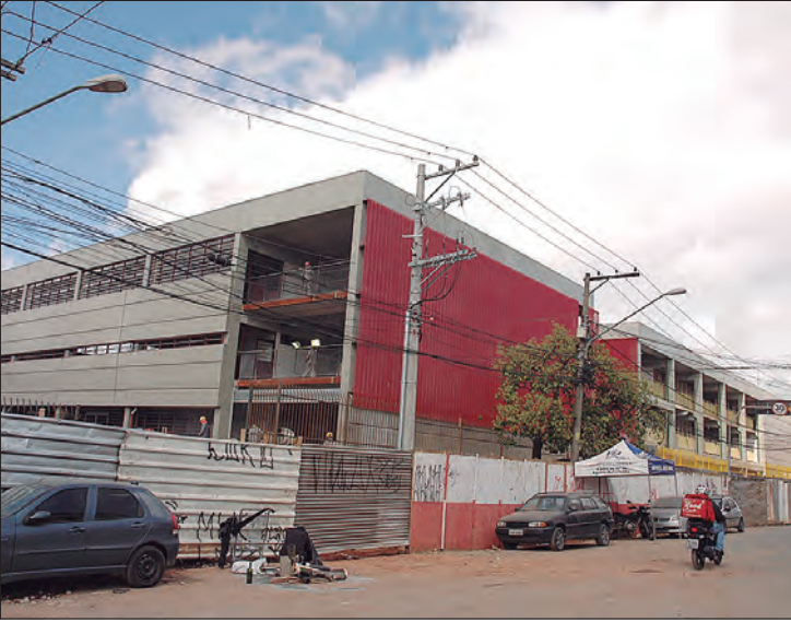
CEU Novo Mundo é um importante equipamento para a população do bairro

Neste ano, o bairro ganhou um importante equipamento para sua população. Localizado na Avenida Ernesto Augusto Lopes, 100, o Centro Educacional Unificado Novo Mundo está praticamente pronto para receber os alunos, dependendo das determinações de retorno das atividades das instituições de ensino devido a pandemia do novo Coronavírus. O CEU Novo Mundo agrega em sua denominação, o nome do jogador e técnico brasileiro Leônidas da Silva (1913/2004) conhecido como "Diamante Negro" e criador da jogada de craques chamada como "Bicicleta".