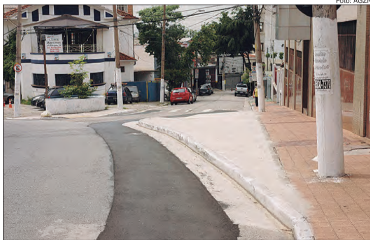
Motoristas e motociclistas reclamam da falta de sinalização em avanço da calçada na Rua Amaral Gama

Com pouca movimentação nessa área, especialmente à noite, a iluminação também fica deficiente o que pode pegar muitos motoristas de surpresa. Em nossa edição de 4/9