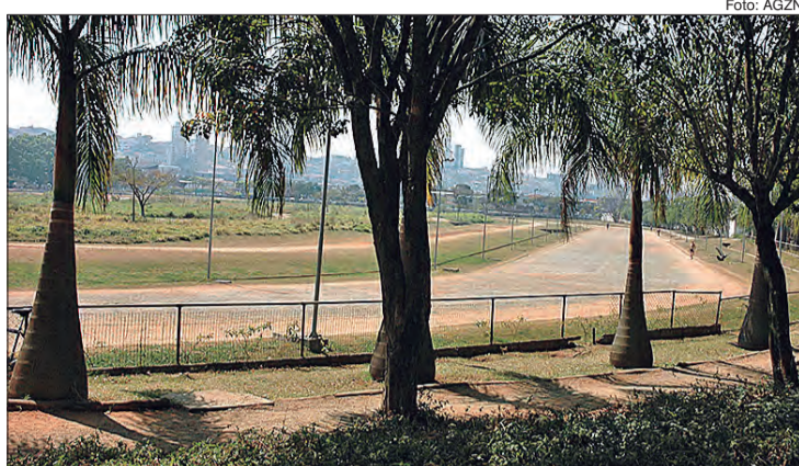
Parque Vila Guilherme Trote é uma das unidades que retomam o funcionamento aos finais de semana

A retomada das atividades dos parques na Capital,