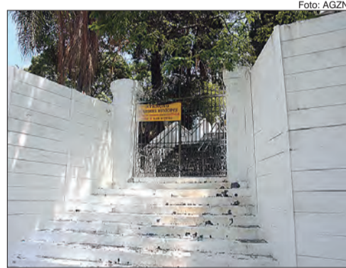
Por conta do Coronavírus os horários dos cemitérios estarão diferenciados

Para celebrações religiosas, cada instituição foi orientada quanto às regras que devem ser seguidas, tais como: uso obrigatório de máscara, álcool em gel, seguindo o protocolo de distanciamento social. Também foram orientadas a realizarem as cerimônias nos espaços abertos dos cemitérios