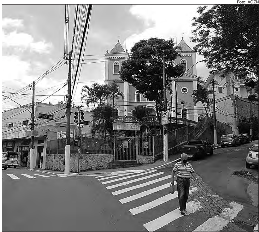
Paróquia de São Pedro Apóstolo é um dos pontos históricos mais importantes do Tremembé

Em 1924 foram lançados os alicerces da Igreja de São Pedro de Tremembé. Em 1922, os próximos moradores ajudaram na instalação da luz elétrica no bairro. A partir de 1928, as primeiras ruas começaram a receber asfalto. Seus primeiros moradores atestam que a data da fundação é de 13 de novembro de 1890, data da primeira escritura de terras do Tremembé.