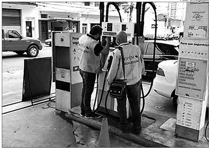
Ipem-SP orienta sobre os cuidados na hora do abastecimento do veículo

os postos são obrigados a ter. Fique atento para possíveis falhas de energia na bomba medidora após pedir esse ensaio e, antes de testar a bomba, verifique se o aferidor encontra-se lacrado e sem qualquer material em seu interior que possa reduzir seu volume;