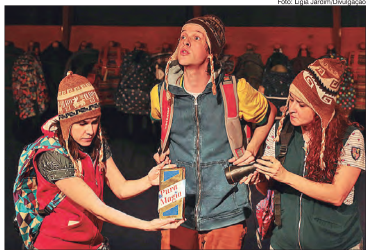
Cena da peça O Dia Que Minha Vida Mudou

O PROGRAMA ALFA DANÇA apresenta São Paulo Com-