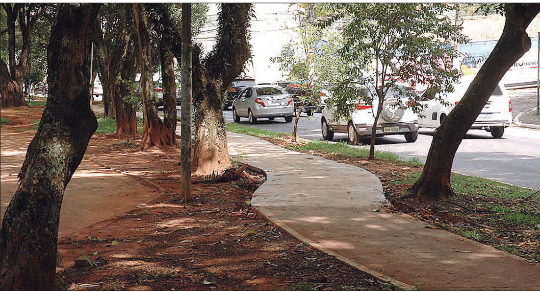
Ciclovia sem sinalização causa transtornos aos ciclistas

A Prefeitura de São Paulo informou na última quinta-feira (5), que a subprefeitura irá fazer a reforma das ondulações na Braz Leme. Porém, o reparo no local será feito somente depois das obras de requalificação da ciclovia.