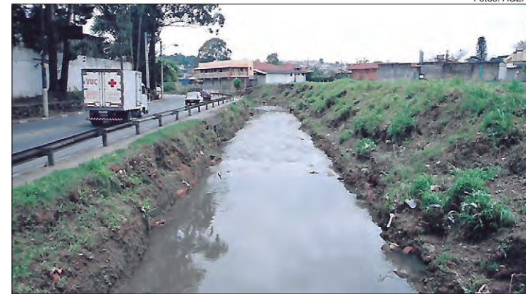
Córrego Tremembé antes das obras de contenção de cheias e construção de reservatórios

De acordo com a Prefeitura de São Paulo, a atual gestão entregou os piscinões R1, R2 e R3, além da canalização de 700 metros do Córrego Tremembé entre a Rua Imbiras e a Avenida Coronel Sezefredo Fagundes. Para concluir todo o projeto, a Prefeitura afirma aguardar a finalização de ações de desapropriações e projetos executivos. No total, serão investidos R$ 103,7 milhões nas obras da bacia do Córrego Tremembé