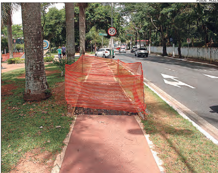
Sinalização refeita após o questionamento da equipe de reportagem

Na última semana recebemos uma reclamação de ciclistas, em relação à falta de sinalização da reforma na ciclovia da Avenida Braz Leme. De acordo com os relatos, há muitos buracos sem sinalização que causam acidentes e, caso a pessoa não preste atenção no percurso acaba se machucando. Entramos em contato com a Prefeitura e a Companhia de Engenharia de Tráfego (CET) e, em resposta a Secretaria Municipal de Mobilidade e Transportes esclarece que em relação à ciclovia da Braz Leme, há uma requalificação da estrutura, na altura do número 1.020, já concluída. Porém, as obras continuam por toda a ciclovia e os reparos serão feitos, nos trechos em que tenha sido diagnosticada a necessidade. As obras de requalificação em toda a extensão da ciclovia devem ser finalizadas até o fim de novembro.