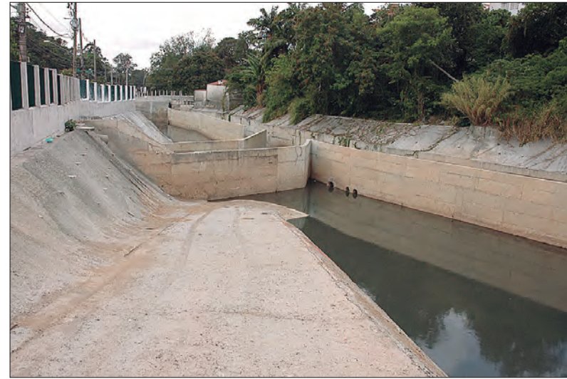
Ao longo da Avenida Maria Amália Lopes de Azevedo está parte das obras já concluídas