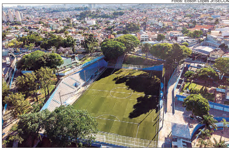
Revitalização do espaço inclui recuperação total do Campo de Futebol, entre outras obras

No total, o município de São Paulo oferece 47 Centros Esportivos para a população, em todas as regiões da cidade. Todos respeitando os protocolos, segundo recomendações da Vigilância Sanitária, prontos para receber os frequentadores para todas as atividades, assim que for autorizado.