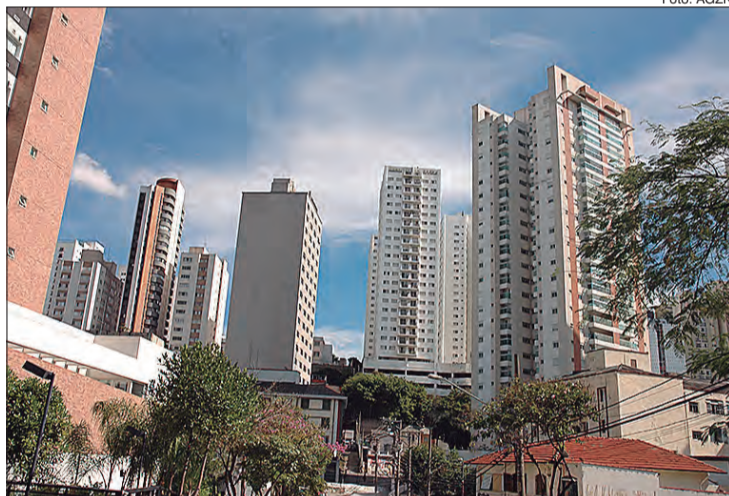
Levantamento aponta retomada dos negócios em 'V', com movimentação do setor em razão de novas necessidades de empresas e empreendedores; salas e conjuntos comerciais lideram novos contratos

A diretora da Lello diz que, de um lado, houve popularização do home-office, com a tendência de busca por espaços menores e mais baratos ou troca de localização das empresas, pelo mesmo motivo. Por outro lado, há os profissionais liberais, tais como: médicos, dentistas e clínicas de estética e beleza, que vão sempre precisar de um local de atendimento presencial, mas dentro de