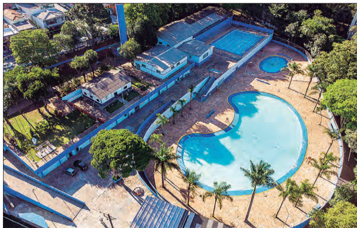
Houve revitalização de outras áreas como: cobertura do ginásio, acessibilidade, além de obras civis de hidráulica, elétrica e serralheria nos vestiários e outras dependências