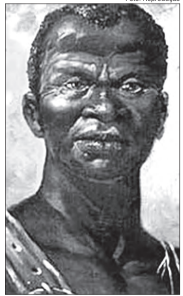
O feriado é uma homenagem a Zumbi dos Palmares que foi assassinado nesse dia por tropas coloniais brasileiras, e por ser símbolo de resistência

Neste ano devemos lembrar que o prefeito da Cidade de São Paulo, Bruno Covas, assinou um decreto e foi publicado no Diário Oficial no dia 19 de maio de 2020, sobre o adiamento do feriado em função da pandemia da Covid-19. Portanto, não haverá feriado nesta sexta-feira (20). O objetivo era aumentar o isolamento social por conta do coronavírus.