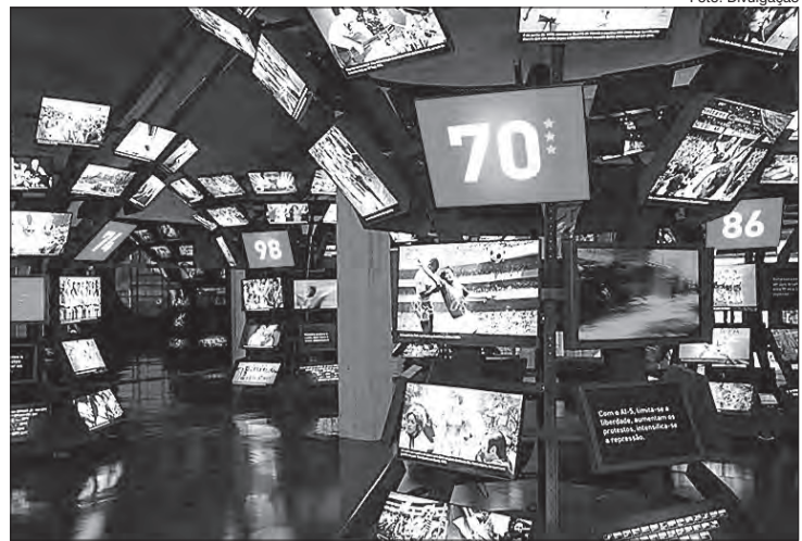
Educadores do Museu farão atividades por meio de vídeo chamadas para turmas de crianças e jovens de instituições de ensino de todo o País

Para que a atividade seja mais proveitosa para cada grupo, o professor ou responsável pela turma informa, na hora da inscrição, quais os temas que estão sendo trabalhados em sala de aula. Os educadores do Museu então fazem um roteiro personalizado, específico para cada atendimento. Disciplinas como: Geografia, História, Artes, Educação Física e Língua Portuguesa são apenas alguns dos exemplos que podem ser trabalhados pela equipe