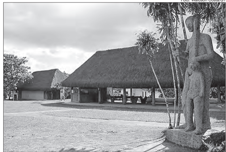
O Quilombo dos Palmares, maior centro de resistência negra do Brasil Colonial em Serra

A Lei também traz a inclusão da temática “História e Cultura Afro-Brasileira” no currículo escolar, resgatando a contribuição do povo negro nas