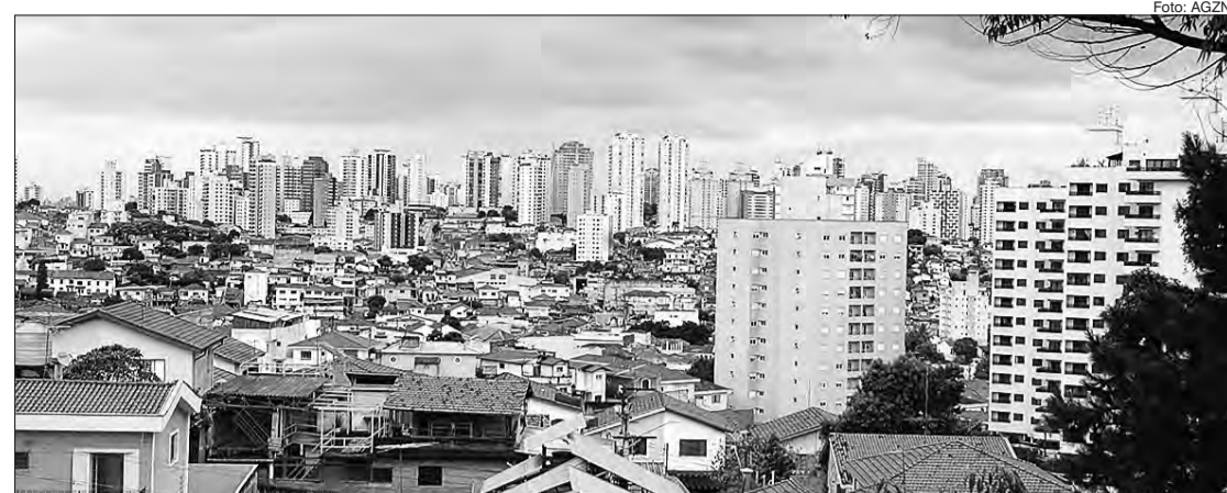
Em outubro, foram protocoladas 878 ações, o que representa uma queda de 5,8% em relação ao mês anterior

De acordo com levantamento realizado pelo Secovi-SP no Tribunal de Justiça do Estado de São Paulo, houve queda no número de ações judiciais por falta de pagamento do condomínio na cidade de São Paulo. Em outubro, foram protocoladas 878 ações condominiais, o que representa uma queda de 5,8% em relação a setembro, que registrou 932 casos. Em relação ao mesmo mês do ano anterior, a redução foi de 8,4% (958 ações).