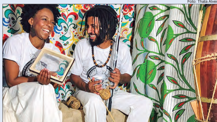
Atividades são conduzidas pela temática que atravessa o mês de novembro no País e promovem a reflexão

Durante novembro, as Fábricas de Cultura, equipamentos da Secretaria de Cultura e Economia Criativa do Governo do Estado de São Paulo e gerenciadas pela Poieis, apresentam uma extensa programação dedicada ao mês da Consciência Negra. As atividades são gratuitas e on-line e acontecem pelas plataformas das Fábricas de Cultura no Facebook (@fabricas decultura), YouTube (@fabricas decultura) e Instagram (fabricas deculturasn) sem necessidade de inscrição.