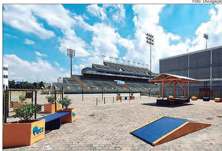
"Petz Play" conta com parquinho ao ar livre, área de sombra e bebedouro para os pets

A Arena Anhembi, também conhecida como Sambódromo, foi aberta ao público pela