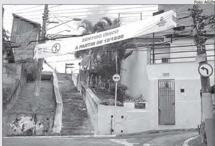
A medida tem como objetivo melhorar as condições de segurança de pedestres e de fluidez no trânsito local

A Companhia de Engenharia de Tráfego (CET), alterou a circulação nas ruas: Hebe, Estela Fidalgo e Salvador Carvalho do Amaral Gurgel, na Vila Dom Pedro II, Parada Inglesa, Zona Norte da cidade, desde sábado (12). A medida tem como objetivo melhorar as condições de segurança de pedestres e de fluidez no trânsito local.