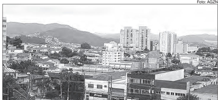
Dados obtidos pelo Secovi-SP junto ao TJSP mostram que, desde agosto houve diminuição no número de processos judiciais relacionados ao mercado de locação

Acumulado - De janeiro a novembro deste ano, foram protocoladas 12.179 ações, uma queda de 16,5% em relação ao mesmo período do ano anterior, com 14.589 ocorrências. O total de ações acumuladas no período de dezembro de 2019 a novembro de 2020 foi de 13.256 casos, redução de 15,5% diante do acumulado de dezembro de 2018 a