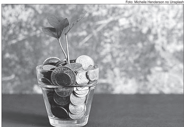
Com pouco ou até nenhum investimento, é possível oferecer um serviço e abrir curso on-line

Com mais de 1,7 milhão de profissionais cadastrados em sua base, o GetNinjas é o maior aplicativo de contratação de serviços da América Latina. Presente em mais de 3 mil cidades brasileiras, a plataforma é um recurso rentável para aqueles que querem encontrar clientes e divulgar seus serviços. São mais de 500 tipos de serviços disponíveis e há espaço para áreas diversas como de: reformas, moda e beleza, assistência técnica, serviços domésticos,