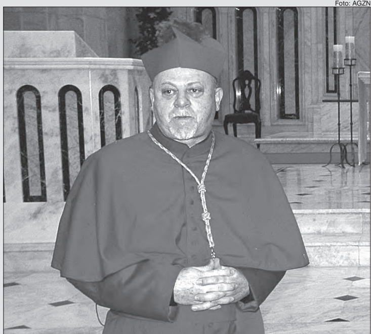
Bispo Auxiliar da Arquidiocese de São Paulo - Região Episcopal Sant'Ana

O “Sim!” de Maria possibilitou - de maneira extraordinária - que “o extraordinário” irrompesse na história! Mulher plena de esperança, não questionou a vontade de Deus para sua vida. Pela obediência do seu “eis aqui a serva do Senhor, faça-se em mim segundo a tua palavra” é que o céu veio até nós. A jovem de Nazaré recebeu o dom da divina maternidade e gerou o Messias, que veio para libertar a humanidade que vivia nas trevas. Obrigado, Maria, pelo “Sim!” generoso, corajoso, proferido na fé! E ensinai-nos a ter a firmeza que te moveu