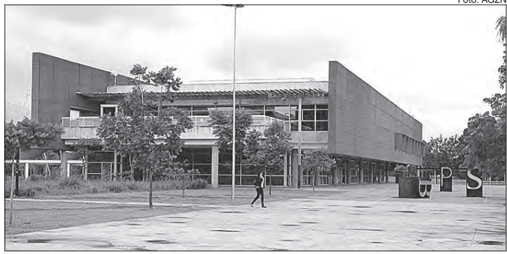
Biblioteca de São Paulo passa a oferecer acervo digital

O acesso gratuito é oferecido aos sócios das bibliotecas ou a quem quiser se associar. Basta acessar spleituras.odilo.us , inserir o número de matrícula e senha ou então baixar o