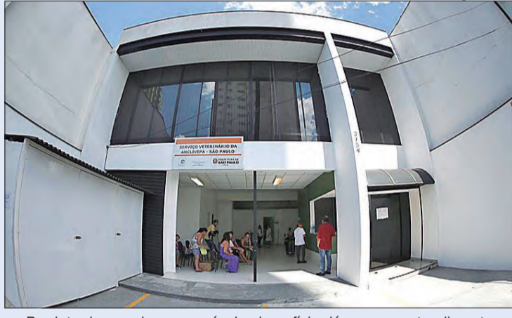
Produto da guarda responsável, o benefício dá acesso a atendimento vitalício e prioritário em qualquer um dos três hospitais veterinários públicos da capital paulista

Por não preencherem os requisitos que as pessoas geralmente procuram ao adotar, esses animais aguardam anos e anos para o grande dia. A única obrigatoriedade do programa é que o animal reside em São Paulo e que a adoção seja realizada no Centro Municipal de Adoção.