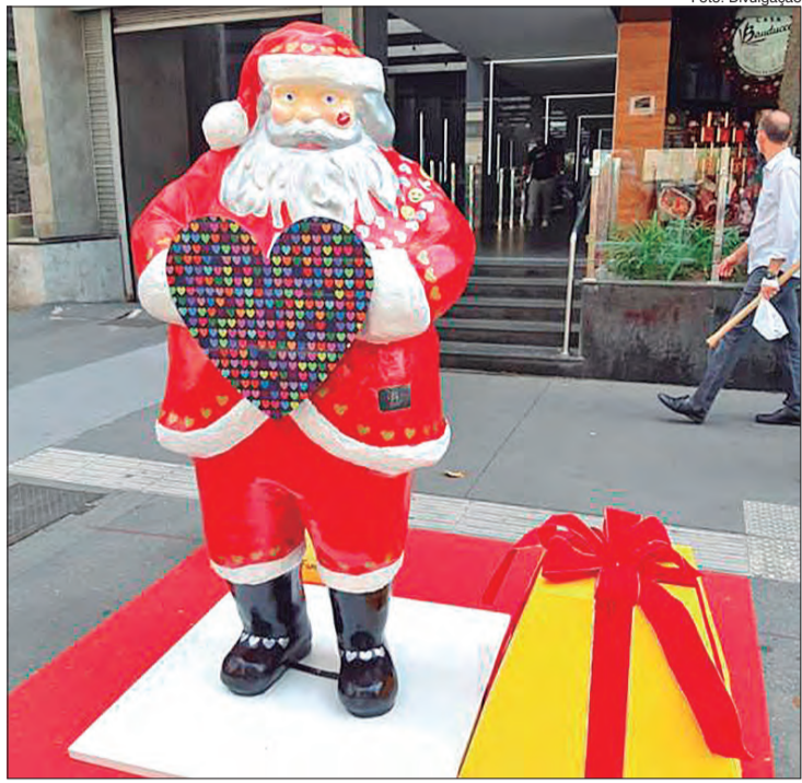
Com traços e pinceladas de grafismo, artistas deixam sua singularidade e marca em esculturas de tamanho natural do bom velhinho; completam a decoração da via uma árvore natalina com 10 metros de altura e iluminação especial nas árvores junto às grades do Parque Trianon

explica que, para integrar o time de convidados para estilizar a figura do Papai Noel, buscaram por artistas populares que deixam sua própria marca na cidade, os grafistas. À frente de cada Papai Noel foi instalado um totem de identificação de cada obra e, por meio de QR Code, o público tem acesso a vídeos gravados por cada autor, mostrando o “making off” de seu trabalho, com depoimento da motivação e o porquê de ter customizado o Papai Noel daquela forma (como escolha de cores, de texturas), assim como o link do site da Bauducco.