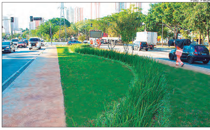
Ações incluem plantio de mudas de plantas e reforma de calçadas danificadas nos trechos contemplados

O projeto utiliza o paisagismo para planejar um novo desenho da área urbana, com etapas de correção do solo, adubação, plantio de mudas, desbragamento de grama e poda de árvores”, disse Caroline