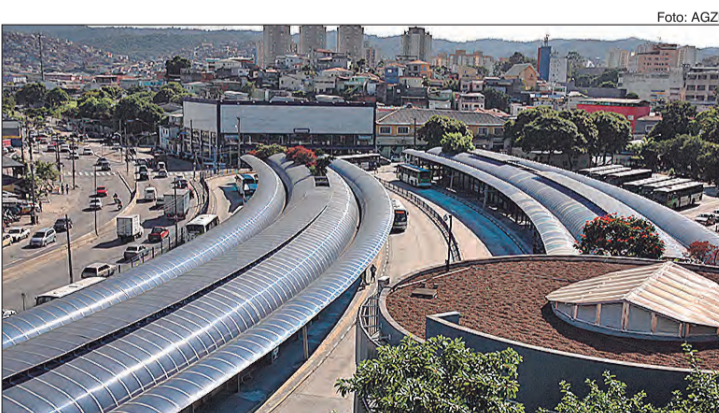
A iniciativa não interfere na operação das linhas nos terminais

A Prefeitura de São Paulo, por meio da SPTrans, informa que a unidade móvel LGBTI (Lésbicas, Gays, Bissexuais, Travestis, Transsexuais e Intersexuais), pertencente ao Centro de Cidadania LGBTI da Secretaria Municipal de Direitos Humanos e Cidadania, realizará atendimento nos terminais Pirituba, Casa Verde, Jardim Britânia e Vila Nova Cachoeirinha entre os dias 15 e 29 de dezembro.