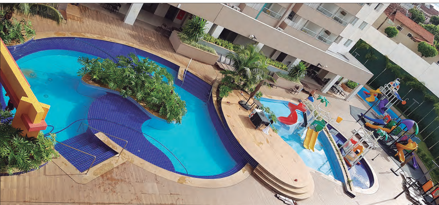
Destinos como Olímpia são acessíveis de carro e rede hoteleira assegura protocolos de saúde

mais conforto, crianças de até 12 anos não pagam hospedagem e ganham ingressos para o Vale dos Dinossauros, outro parque localizado na cidade. Para mais informações no site oficial da Enjoy Hotéis e Resorts: https://www.enjoyhoteis.com.br/