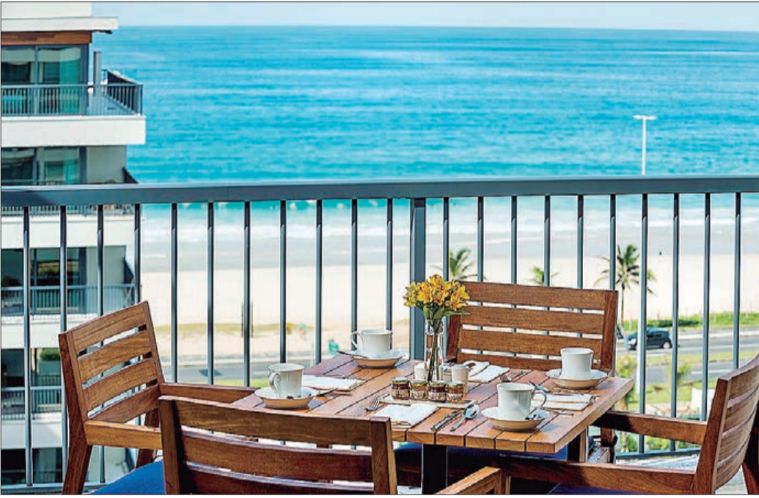
Pacote "Rio, seu lindo!". De 1º de março a 30 de maio

O pacote pode ser adquirido pelo site: http://www.hyatt.com/pt-PT/hotel/brazil/grand-hyatt-rio-de-janeiro/riohq?offercode=lindo