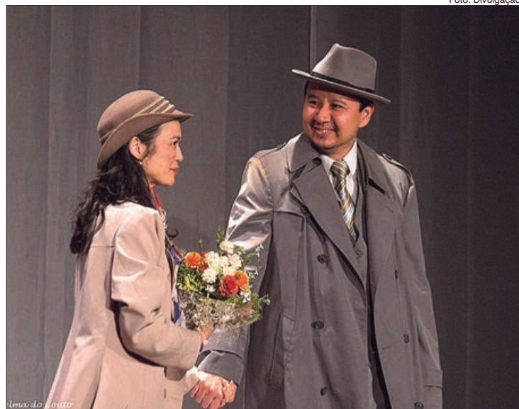
Cena de O Legítimo Pai da Bomba Atômica

NA MONTAGEM personagens reais de diversas nacionalidades (alemão, americano, húngaro, etc) são interpretados por atores nipo-brasileiros. “Nossa proposta é justificada