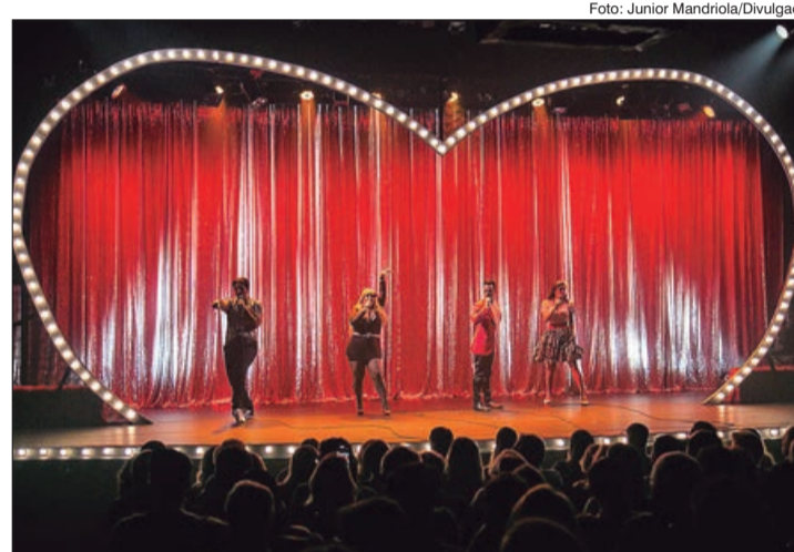
Cena do musical O Meu Sangue Ferve Por Você