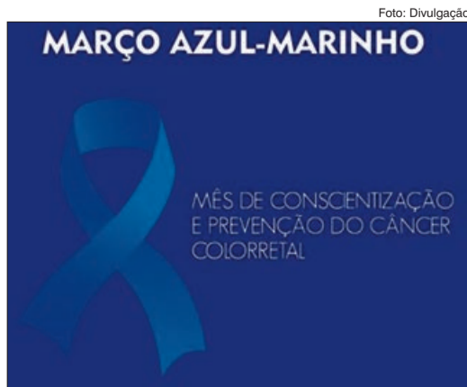
Mês de março é marcado pela conscientização à prevenção da doença

A colonoscopia é realizada com o paciente sedado, de forma indolor. As Sociedades de Gastroenterologia e Endoscopia sugerem que o exame seja realizado a partir dos 45 anos para rastreamento do Câncer do cólon e reto, porém sua recomendação pode ser antecipada a depender dos sintomas e histórico do paciente.