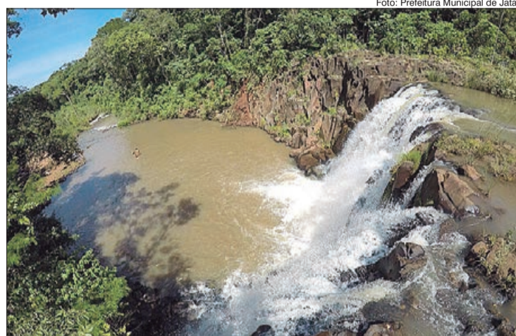
Belas cachoeiras, Jataí, Goiás

No Sudoeste Goiano, Jataí tem cerca de 100 mil habitantes e se destaca como importan-