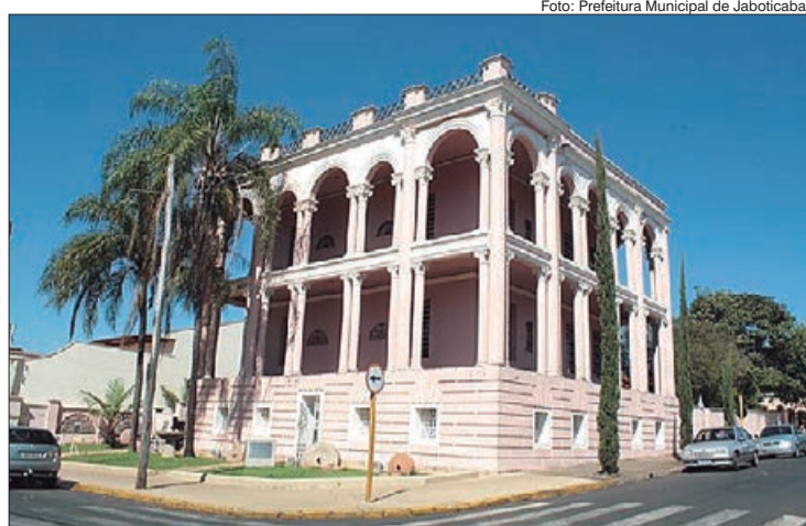
Museu Histórico de Jaboticabal Aloísio de Almeida

belezas naturais do distrito de Pontalete, um dos pontos de encontro nos dias quentes e o Museu do Café que resgata a história da cafeicultura mineira são, com certeza, pontos a se visitar para fotografar.