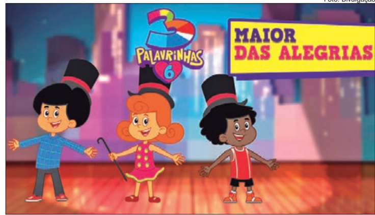
Lançamento de música sobre união e louvor

A música fala sobre harmonia e, especialmente, da felicidade que é estar com irmãos de fé, compartilhando o mesmo ambiente e, principalmente, o mesmo ideal: louvar a Deus e levar a mensagem Dele para mais e mais pessoas. O clipe também traz esse clima de total alegria, com muitas luzes, efeitos, animação, cores e criatividade que só essa turminha tem.