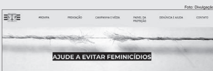
Medidas protetivas aumentaram 73% nos últimos três anos

Muitas das vezes, relacionamentos abusivos começam com algumas atitudes encaradas como “excesso de amor”. É preciso atenção porque o controle, o ciúme e os xingamentos podem ser a primeira etapa do chamado ciclo da violência, que é uma alternância - uma fase de paixão, de namoro, seguida de uma agressão; um pedido de perdão, uma reconquista e uma nova violência, inclusive física.