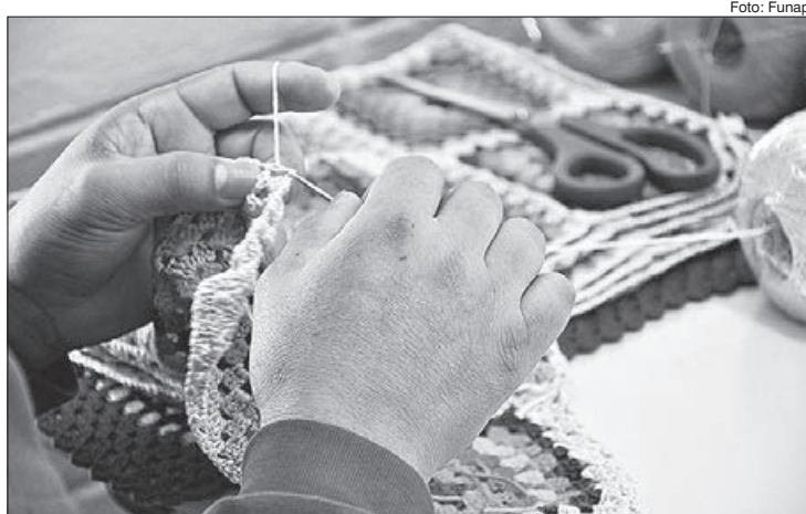
Itens comercializados são frutos de programa de qualificação profissional e reintegração social para reeducandos

Na primeira fase de implantação do e-commerce, estão disponíveis mais de 40 artigos de artesanato de diversas linhas, como patchwork, bordado,