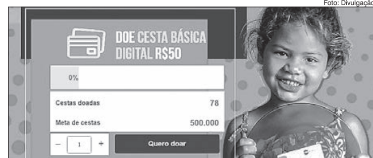
Em 2020, a campanha arrecadou mais de R$ 25 milhões e impactou mais de 420 mil famílias moradoras de favelas e comunidades em todo o País

A medida também incentiva o consumo em comércio instalados em comunidades e favelas,