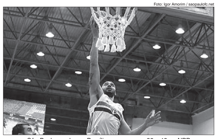
São Paulo recebeu o Brasília e venceu por 92 a 46 no NBB

1. A jogadora de futebol Leticia Santos vinha sendo bastante utilizada pela treinadora da Seleção Brasileira, Pia Sundhage. Sua primeira passagem pela seleção principal foi em 2017 e de lá para cá foram diversas participações, entre elas na Copa do Mundo 2019, realizada na França. A lateral-direita sofreu um trauma rotacional na região do joelho direito, ocasionando uma ruptura do ligamento cruzado anterior. A previsão de retorno era de seis a sete meses com necessidade de cirurgia. Por isso, o tempo de recuperação era curto demais até os jogos de Tóquio, inicialmente marcados para julho de 2020.