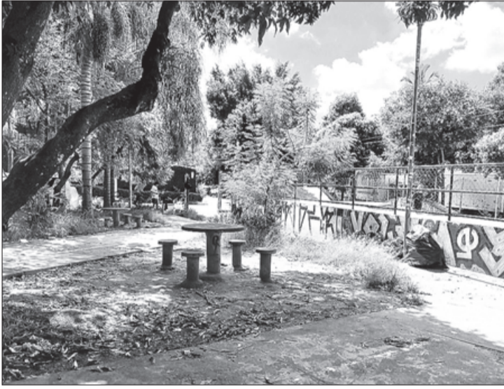
Praça Vereador Antônio Sampaio chama atenção pelo mato alto e acúmulo de lixo

Mato alto, acúmulo de lixo e abrigos utilizados por pessoas em situação de rua estão presentes na Praça Alberto Pereira de Castro Jr. No local, uma antiga base da Guarda Civil Metropolitana está fechada desde 2009 e, apesar dos diversos apelos da comunidade para uma destinação para o local, permanece em estado de abandono. Em 2016, o local chegou a ser reinaugurado como Núcleo Comunitário Direitos Humanos com o objetivo de prestar serviços para a comunidade, mas a iniciativa não teve sucesso. Além da falta de limpeza e manutenção evidente na praça, o local também serve de abrigo para pessoas em situação de rua, o que também preocupa moradores do bairro. Em frente, está a Praça Vereador Antônio Sampaio, onde uma pista de skate foi inaugurada