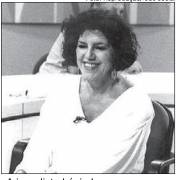
A jornalista Lúcia Leme morreu na última segunda-feira (8)

Na última segunda-feira (8), a jornalista Lúcia Leme, 82 anos, morreu no Rio de Janeiro. Ela lutava contra um Câncer no Pulmão. A jornalista teve uma longa trajetória na carreira televisiva, e ficou marcada especialmente por sua passagem como apresentadora do “Sem Censura”, programa da TV Brasil que comandou entre 1986 e 1996.