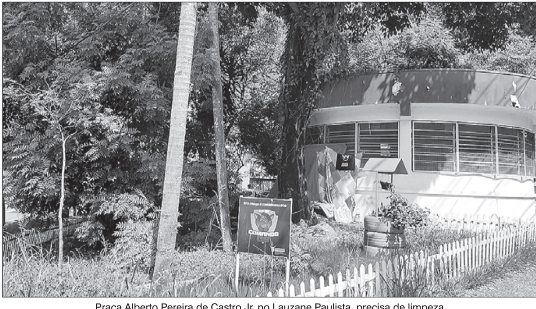
Praça Alberto Pereira de Castro Jr, no Lauzane Paulista, precisa de limpeza, manutenção e serviço de assistência social para pessoas em situação de rua

praças, a população utiliza bastante esses espaços, comprovando sua importância para o bairro.