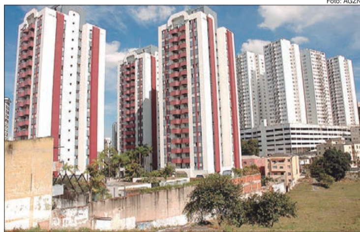
Condomínios devem orientar moradores sobre as medidas de distanciamento social e uso das áreas comuns

Quanto à realização de assembleias, a diretora do Secovi-SP recomenda o cancelamento