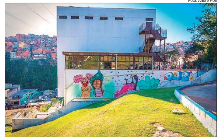
As unidades Vila Nova Cachoeirinha e Jardim São Luís foram fundadas em 2012, enquanto que a localizada no Jaçanã funciona desde 2013. Todas as atividades são gratuitas e, seguindo os protocolos de combate à Covid-19, ocorrendo por canais virtuais do Programa

Para celebrar os nove anos de existência, a Fábrica de Cultura Vila Nova Cachoeirinha, localizada na região norte de São Paulo, convida a plateia virtual para assistir uma homenagem à unidade, em vídeo, feita por funcionários como forma de mostrar como a comunidade vem contribuindo para o fortalecimento do local. A transmissão ocorre via Facebook ( https://