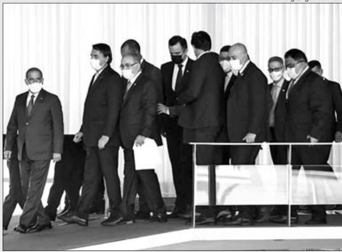
Presidente Jair Bolsonaro anuncia comitê de combate à pandemia após reunião com chefes dos demais poderes

Após reunião com chefes dos demais Poderes, ministro e governadores aliados na manhã da última quarta-feira (24), o presidente Jair Bolsonaro anunciou a criação de um comitê voltado ao combate da pandemia de Covid-19. Sem a presença de governadores ou prefeitos, a reunião aconteceu no Palácio da Alvorada e afirmou que haverá uma coordenação com os governadores, comandada pelo deputado Artur Lira. A reunião foi realizada no dia seguinte, quando o Brasil superou pela primeira vez a marca de 3 mil mortos pela Covid-19 em um único dia. Devido a vacinação em massa, o presidente voltou a defender a utilização de "tratamento precoce", o que segundo Bolsonaro, ficará