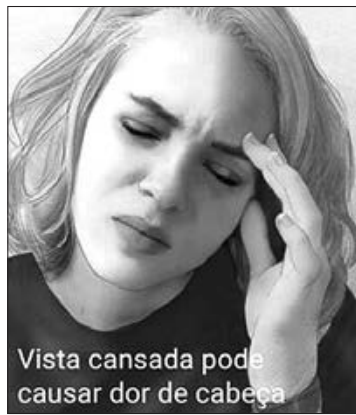
Vista cansada pode causar dor de cabeça

1 - Glaucoma - Sem controle médico, o aumento da pressão