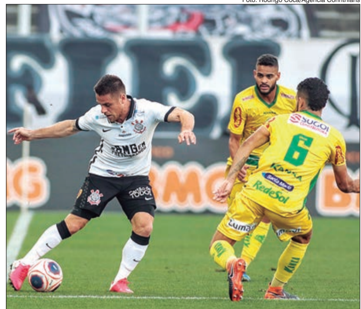
Em Volta Redonda, o Alvinegro entrou em campo como visitante em partida válida pela quinta rodada do torneio estadual e venceu por 1 a 0

primeiro troféu como técnica da equipe de Araraquara.