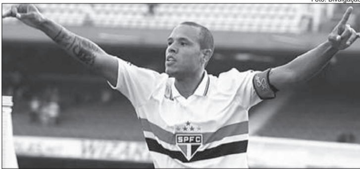
O ex-jogador Luís Fabiano

Luís Fabiano está bem, em um quarto comum de hospital, e não precisa de auxílio de aparelhos respiratórios.