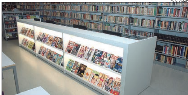
Biblioteca São Paulo destaca atividades comemorativas à Literatura