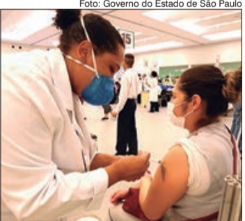
São esperados cerca de 20 mil trabalhadores em toda a rede de vacinação da cidade de São Paulo

Começou a vacinação do grupo prioritário formado por trabalhadores dos serviços da área de Saúde com 50 anos ou mais. O público-alvo é de 20 mil pessoas. Trabalhadores dos serviços de Saúde são todos aqueles que atuam em espaços e estabelecimentos de assistência e vigilância à saúde, sejam eles hospitais, clínicas, ambulatórios, laboratórios e outros locais. Desta maneira,