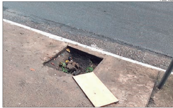
Calçada na Rua Voluntários da Pátria onde falta a tampa de bueiro

A ausência de tampas de bueiros é cada vez mais observada em diferentes ruas do bairro de Santana. Além do acúmulo de lixo nesses locais, esse problema traz perigo para os pedestres que, num momento de distração, podem se acidentarem nesses locais. Por ser constituída de material com algum valor, essas tampas são frequentemente roubadas em vários pontos da cidade. Apesar da dificuldade de evitar esse tipo de acontecimento, é um problema grave que pode propiciar acidentes principalmente para pedestres.