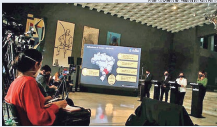
Medidas sociais e nova etapa da campanha de vacinação foram os destaques da coletiva concedida pelo governador João Doria na última quarta-feira (7)

Entre os benefícios, está a contratação de 20 mil pais de alunos da rede estadual para atuar no retorno das aulas mediante remuneração mensal de 500 reais. O governador destacou ainda a doação de cerca de 500 mil cestas básicas pela iniciativa privada para