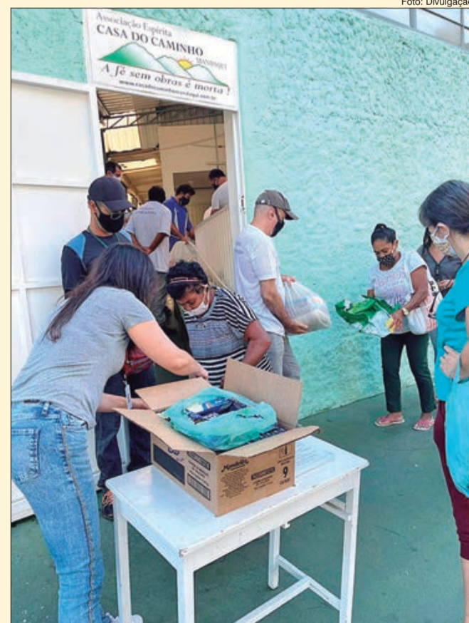
Distribuição de cestas básicas é uma das ações sociais da Associação Casa do Caminho Mandaqui

Todo esse trabalho é realizado através de doações, que podem ser feitas em alimentos, cestas, roupas (que seguirão para o bazar da instituição) ou qualquer valor em dinheiro. Denominada #AmorEmMovimento, a campanha voltada para a aquisição de cestas básicas recebe doações de qualquer valor através de depósitos bancários. Maiores informações pelo tel.: (11) 2231-3827 ou pelo site: www.casado.caminhomandaqui.com.br