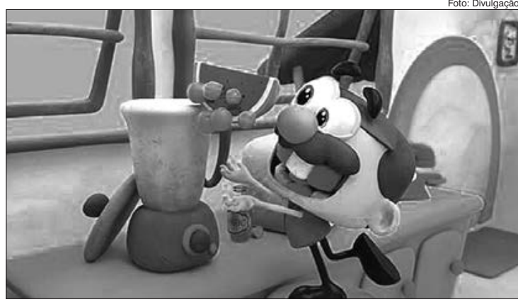
Produção 3D narra trapalhadas do personagem de maneira leve e educativa, reforçando valores de amizade de maneira alegre

Lançada em dezembro, a animação 3D original TotoyKids, "As Aventuras de José Comilão" já é um sucesso! Com episódios de até quatro minutos, a série que narra de maneira lúdica as trapalhadas do carismático personagem, já conquistou mais de