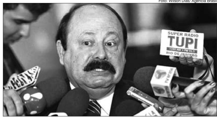
O homem do Aerotrem faleceu na última sexta-feira (23)

Na sexta-feira (23) o político Levy Fidelix, 69 anos, morreu, por complicações da Covid-19, em São Paulo. Levy estava internado desde março em um hospital particular. A informação foi divulgada por uma postagem na rede social do político. "É com profunda dor e pesar que o PRTB, por sua diretoria, comunica o falecimento do nosso Líder Fundador e Presidente Nacional Levy Fidelix, ocorrido nesta data na cidade de São Paulo. Nosso eterno líder deixa como legado o dinamismo, o bom combate, a criatividade, a honradez, a lisura em suas ações e a fé inabalável, que nortearam sua vida pública e privada. Como um brasileiro notável, nunca se furtou aos grandes debates nacionais e de forma direta contribuiu para uma nação mais justa, defendendo a vida, as liberdades individuais e o equilíbrio entre passado,