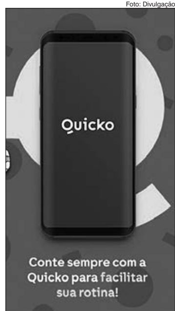
Conte sempre com a Quicko para facilitar sua rotina!

Levantamento recente da Quicko feito com usuários da própria plataforma em São Paulo identificou que para 32% dos entrevistados, o item mais importante para eles na escolha por um meio de transporte é a segurança. Os índices de roubos de celulares são alarmantes. No Estado de São Paulo,