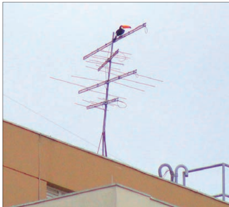
Antena de prédio serve de pouso para tucanos e outros pássaros em bairro da ZN

que Nakel sempre destaca em suas publicações é a importância de plantar árvores frutíferas em condomínios ou