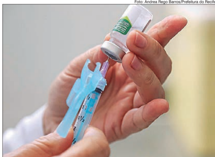
Segunda fase da Campanha vai priorizar idosos e professores das escolas públicas e privadas

A estimativa é que até o dia 9 de julho, data prevista para o encerramento da campanha, pelo menos 4,7 milhões de pessoas recebam a vacina. Neste período, os municípios também