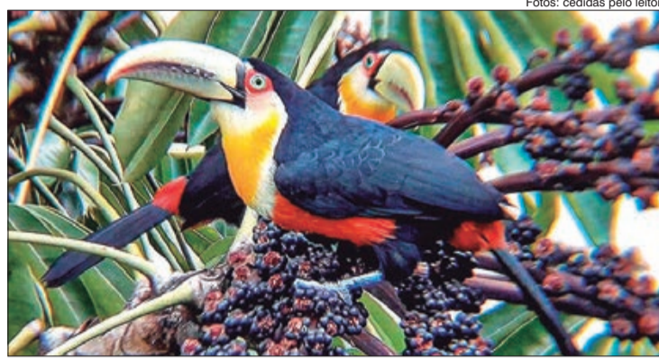
Tucanos são observados no Lauzane Paulista