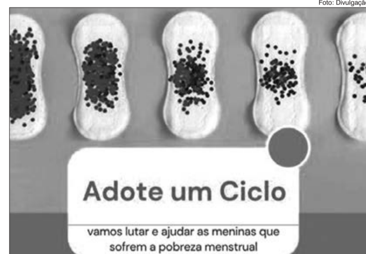
Com envolvimento de empresas, escolas e universidades São Paulo, ação promovida pelo Instituto ELA visa a arrecadação de absorventes higiênicos e a conscientização sobre a saúde da mulher

Mais informações no site: https://www.institutoela.org.br/