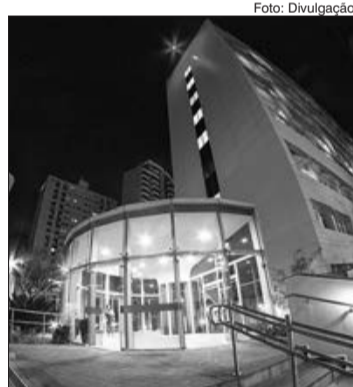
Rede São Camilo SP adere à Campanha Junho Vermelho

Todas as pessoas com idade entre 16 e 69 anos, com peso superior a 50Kg podem ser doadoras de sangue. O voluntário que