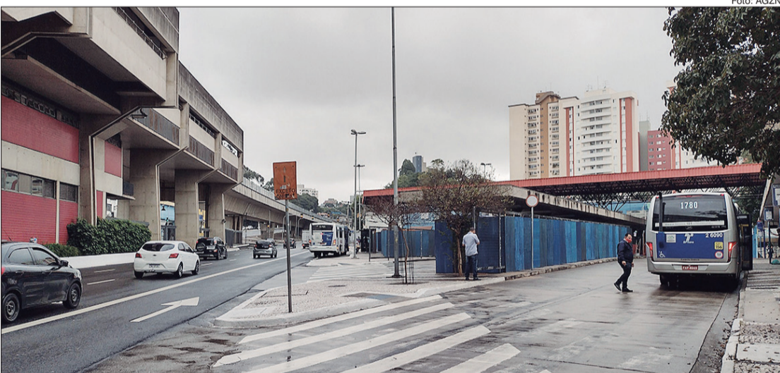
Obras em andamento no Terminal Parada Inglesa

Em Santana, os tradicionais quiosques chegam de cara nova, totalizando mais de 880m² em ABL (Área Bruta Locável). Há uma divisão entre as lojas de alimentação, varejo e serviços e a proposta é que haja os mais variados tipos de estabelecimentos, desde um lanche rápido, até vestuário, serviços de salão de beleza, perfumaria e conserto de eletrônicos, por exemplo. O atendimento funciona todos os dias da semana, das 7 até às 22 horas, no local também há um bicicletário.