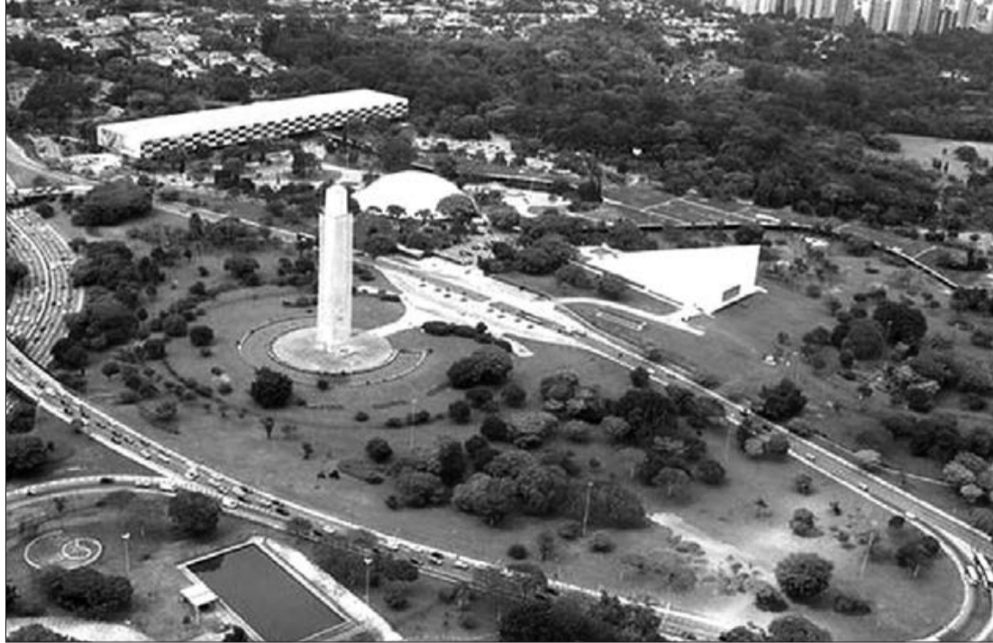
Uma das homenagens à Revolução de 1932 é o Obelisco no Parque Ibirapuera

mas as estimativas não oficiais citam 2.200. Após a revolução, o Estado de São Paulo voltou a ser governado por paulistas. Em 1934 foi decretada uma nova Constituição que deu início a democratização. Getúlio Vargas permaneceu no poder do País por 15 anos (até 1945), em 1954 morreu com um tiro no peito.