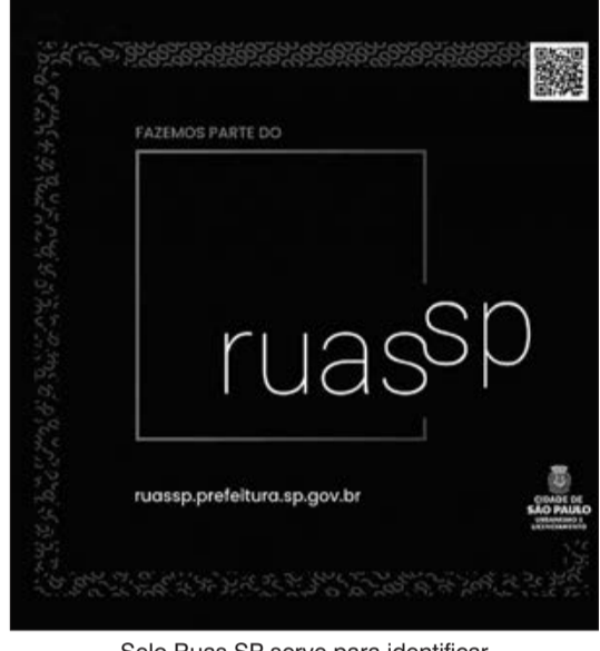
Selo Ruas SP serve para identificar os participantes do projeto

Após cinco meses de lançamento do projeto Ruas SP, 28 bares e restaurantes estão autorizados na cidade a instalar mesas e cadeiras para atendimento ao público em vagas de estacionamento regulamentado, respeitando todos os protocolos sanitários e as regras para o uso do espaço público ao ar livre. Até agora, a Prefeitura de São Paulo, por meio da Secretaria Municipal de Urbanismo e Licenciamento (SMUL), selecionou 89 vias para receber o projeto. Estabelecimentos de outros logradouros também podem solicitar adesão ao Ruas SP.