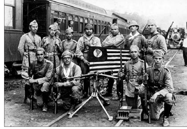
Soldados posando para foto durante a Revolução de 1932

O projeto Ruas SP foi regulamentado em 12 de fevereiro deste ano por meio da Portaria nº 08/2021/SMUL-G após a Prefeitura avaliar como positivo o projeto-piloto realizado na região central em 2020 (Portaria nº 696 / Decreto 59.669). Em abril, a partir do Decreto nº 60.197, o programa foi ampliado para toda a cidade, com o objetivo de oferecer amparo ao setor de bares e restaurantes e, ao mesmo tempo, reduzir os riscos de transmissão da Covid-19 nesta fase de retomada econômica estabelecida pelo Plano São Paulo. Pesquisas apontam que a taxa de transmissão do novo coronavírus é menor em ambientes ao ar livre em comparação a locais fechados.