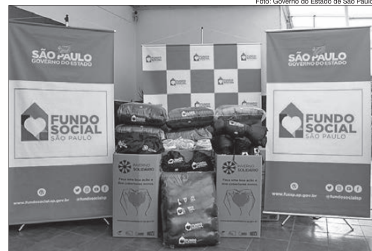
Foram distribuídos 500 cobertores novos, além de 130 cobertores térmicos

A Campanha do Inverno Solidário tem como princípio a distribuição de cobertores recebidos através de doações