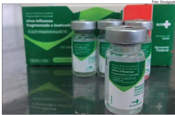
Campanha para os grupos prioritários se encerra nesta sexta-feira (9); cobertura está abaixo de 65%, mas meta é de 90%

Assim, a expansão para a população em geral foi definida pela Secretaria de Estado da Saúde em conjunto com os municípios e permite que mais pessoas se protejam contra o vírus Influenza. Vacinar-se contra a gripe é essencial para reduzir complicações e mortalidade decorrentes das infecções causadas pelo vírus influenza.