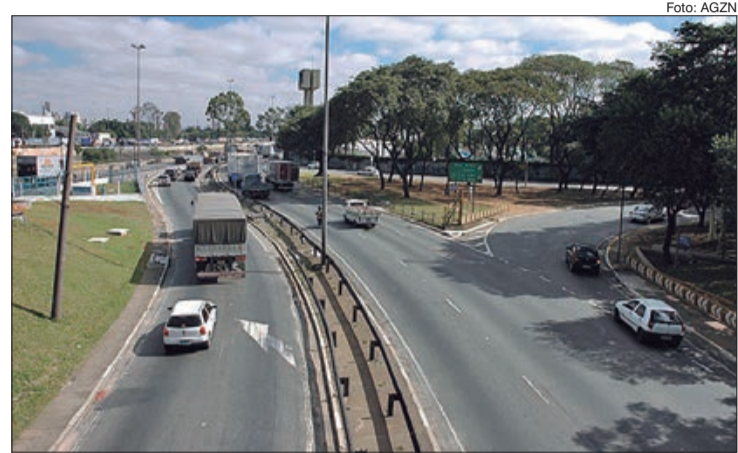
Rodízio municipal continua vigorando de segunda a sexta-feira, das 23 às 5 horas

1 e 2 - das 23 horas de segunda-feira às 5 horas de terça; 3 e 4 - das 23 horas de terça-feira às 5 horas de quarta; 5 e 6 - das 23 horas de quarta-feira às 5 horas de quinta; 7 e 8 - das 23 horas de quinta-feira às 5 horas de sexta;