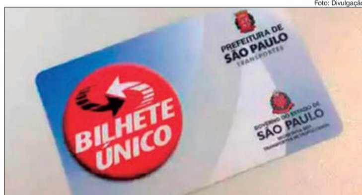
Cadastramento para continuação das recargas pode ser feito pela internet; em 1º de setembro de 2021, os cartões sem cadastro deixarão de existir

Os créditos remanescentes no seu bilhete sem cadastro não serão perdidos, pois serão transferidos para o cartão cadastrado no mesmo CPF ao qual ele for associado.