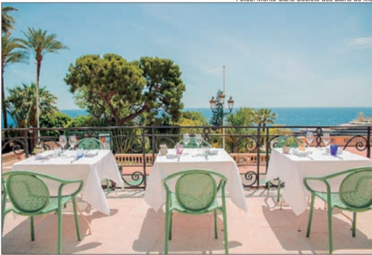
Com a chegada do verão europeu, Mônaco retoma atividades de restaurantes e bares e oferece novas experiências gastronômicas

Mada One - Localizado próximo a Place du Casino em frente ao icônico Cassino de Monte-Carlo, o restaurante Mada One lança o conceito "Mada Lounge" para os finais de tarde e as noites de Mônaco. Em um ambiente boêmio, o "Mada Lounge" funcionará diariamente, das 16 às 21h30, até o dia 28 de agosto.