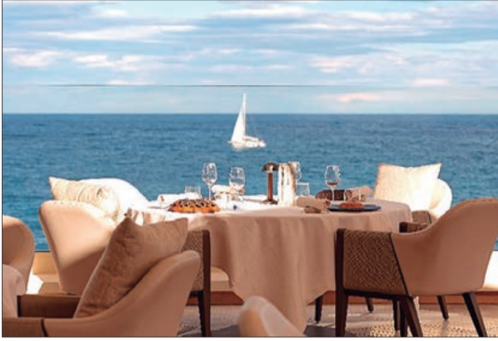
Restaurante Blue Bay do Monte-Carlo Bay Hotel & Resort

La Rascasse - Representante da vida noturna de Mônaco, o La Rascasse retoma suas atividades com performances de DJs nas noites de terça a sábado. Situado em uma das ruas mais famosas do Grande Prêmio de F1 de Mônaco, o La Rascasse é o lugar certo para momentos de descontração e diversão.