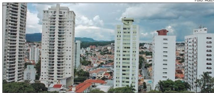
Em maio, foram protocoladas 1.181 ações judiciais relacionadas ao mercado de locação na cidade de São Paulo

As ações ordinárias, que são relativas à retomada de imóvel para uso próprio, de seu ascendente ou descendente, reforma ou denúncia vazia, contabilizaram 74 processos (6,3%). As ações para renovação compulsória de contratos comerciais com prazo de cinco anos somaram 63 protocolos (5,3%). Já as ações consignatórias, movidas quando há discordância de valores de aluguéis ou encargos,