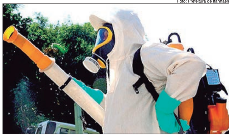
Intensificadas ações de controle da doença em regiões com maior incidência de casos

que podem ser transmitidas por insetos e aracnídeos, como: mosquitos, aranhas e carrapatos, por exemplo. A Dengue, a Zika e a Chikungunya são arboviroses transmitidas pela picada do Aedes Aegypti. Esse mesmo mosquito, no seu ciclo urbano, também pode transmitir a Febre Amarela.