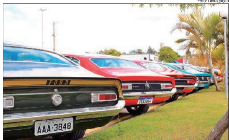
Carros antigos participarão de um evento especial para arrecadação de cestas básicas no dia 26 de setembro

A saída do comboio partirá do Pacaembu às 8 horas em direção à Arena Sambódromo. A exposição ficará disponível na área da dispersão da Arena para todos os visitantes apreciarem. Esse evento é gratuito.