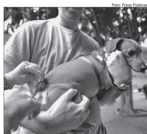
Vacinação anti-rábica é fundamental para cães e gatos

• Uvis Jaçaná Rua Maria Amália Lopes de Azevedo, 3.676, de segunda a sexta, das 9 às 11 horas e das 14 às 16 horas.