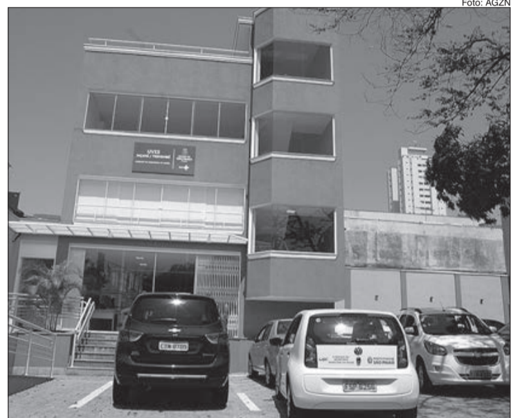
Uvis Jaçaná é um dos pontos de vacinação para animais domésticos na Zona Norte

Os cães são os principais transmissores dessa zoonose às pessoas. Por isso, a vacinação dos bichinhos de estimação é fundamental para prevenir a propagação da doença.