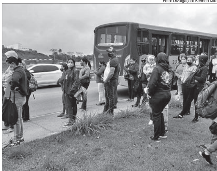
Ônibus quebrado deixando os passageiros na mão

A SPTrans foi questionada sobre esses problemas e, se há algum projeto para possíveis melhorias do serviço naquela