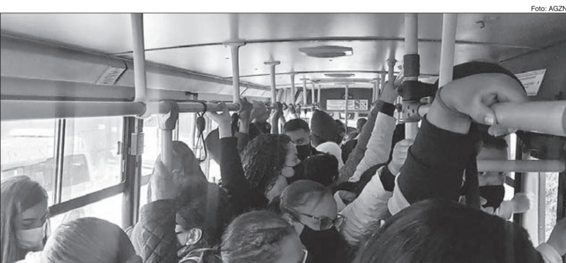
Interior do ônibus lotado devido a demora no intervalo do ônibus

É imprescindível que os usuários registrem as reclamações para contribuir com a melhoria da qualidade do transporte público, registrando reclamações e sugestões por meio da Central 156 e do site http://sp156.prefeitura.sp.gov.br .