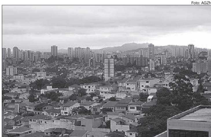
Os contratos de locação em andamento, corrigidos pelo índice e com aniversário em outubro, poderão ser reajustados com base neste percentual

Contrato com aniversário em outubro/2020 e pagamento em novembro/2020: 1,1794