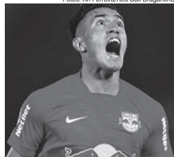
O Bragantino vai a final da Copa Sul-Americana e Cuello foi o nome do jogo

1. A Final da Taça Libertadores da América será disputada entre duas equipes brasileiras, Flamengo e Palmeiras, e será a quarta da história entre duas equipes do Brasil. Os times brasileiros disputarão a competição continental no dia 27 de novembro no estádio Centenário, em Montevidéu (Uruguai). A final da Libertadores de 2021 será a segunda consecutiva com a presença do Palmeiras. No ano passado venceu o Santos por 1 a 0 no estádio do Maracanã para ficar com o título.