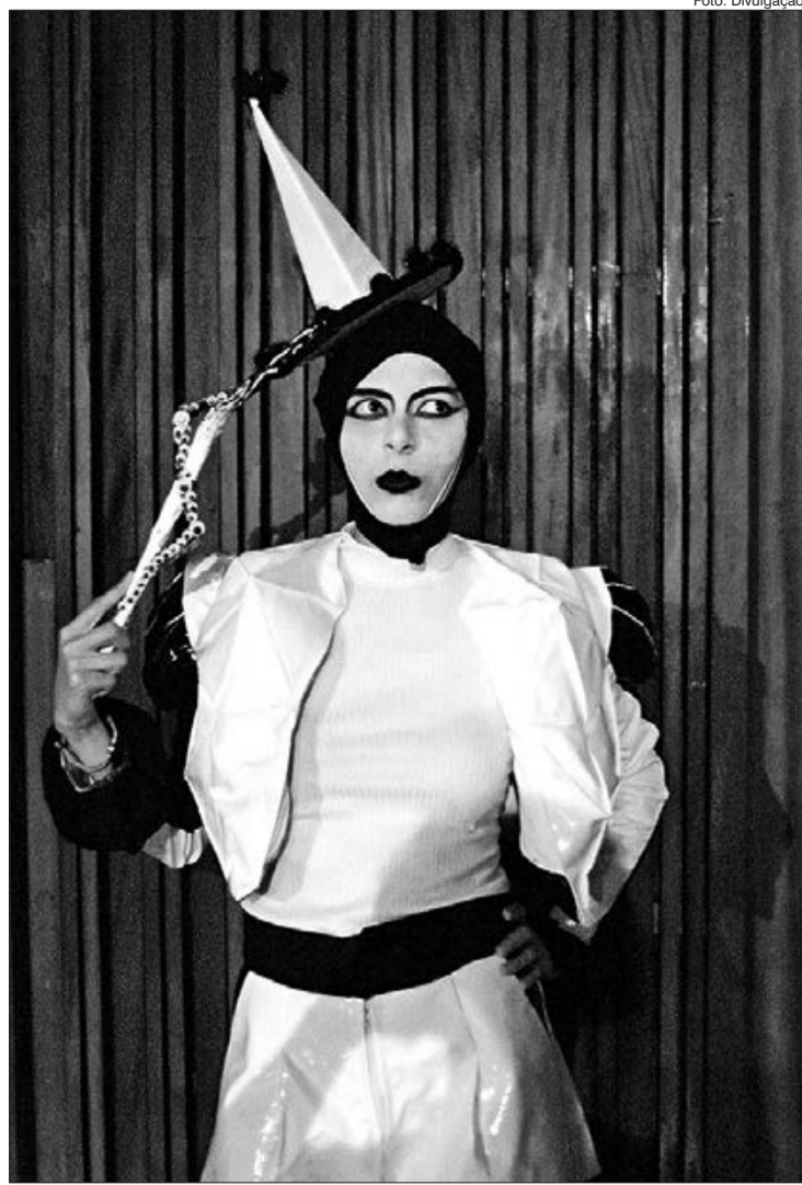
Peça 'O Tribunal de Rosas dos Ventos' estará em cartaz de 6 a 28 de novembro, aos sábados e domingos

'Drags de Novo no Alfredo -- Coachs' continua em cartaz todo domingo até 28/11/2021, às 19h, e tem duração de 90 min, é livre. Ingresso grátis - uma hora antes. Trata-se de uma noite de apresentações voltadas a enaltecer estilos e estéticas drag diferentes, a partir da mentoria de drags consagradas na cena Paulista.