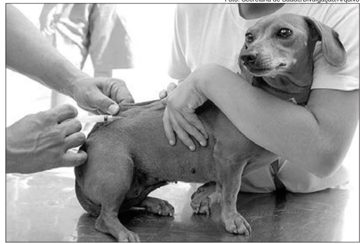
Vacinação contra a raiva para cães e gatos é oferecida gratuitamente pela Divisão de Vigilância de Zoonoses

Vale lembrar que vacinar o animal é a melhor forma de protegê-lo da raiva, doença que pode ser transmitida para humanos pelo contato com a saliva infectada, seja por uma mordida ou arranhão. Para receber o imunizante, cães bravos ou mordedores devem utilizar focinheira apropriada. Já os gatos devem ser levados em caixas de transporte. Animais que estejam com diarreia, em tratamento ou pós-cirurgia devem aguardar a plena recuperação.