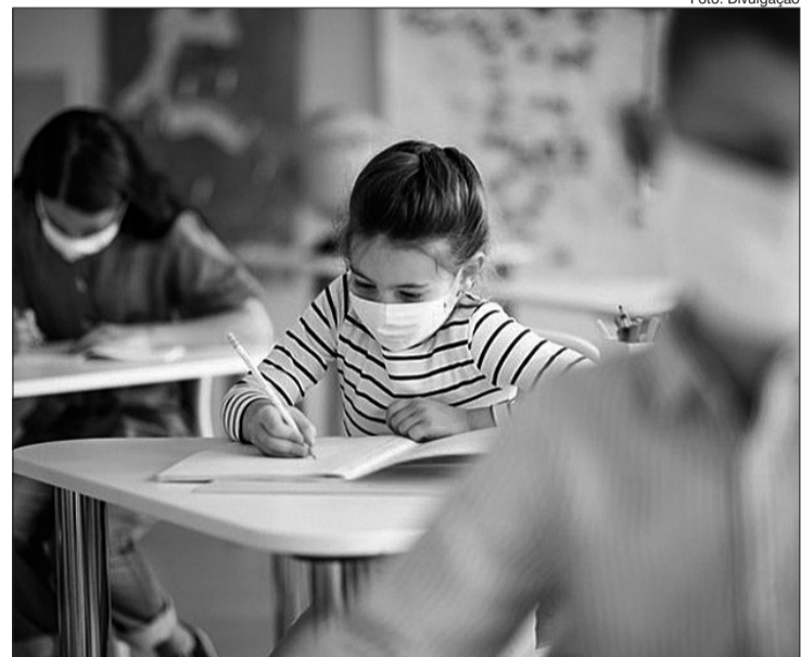
As aulas terão início em 2 de fevereiro com término em 23 de dezembro; recessos acontecem em abril e outubro e as férias ocorrerão em julho e janeiro

Recuperação nas férias: entre 4 e 21 de janeiro